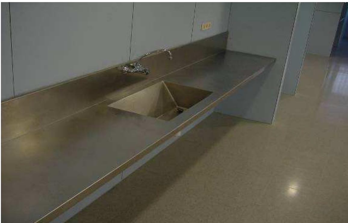
CUBETAS ESPECIALES A MEDIDA