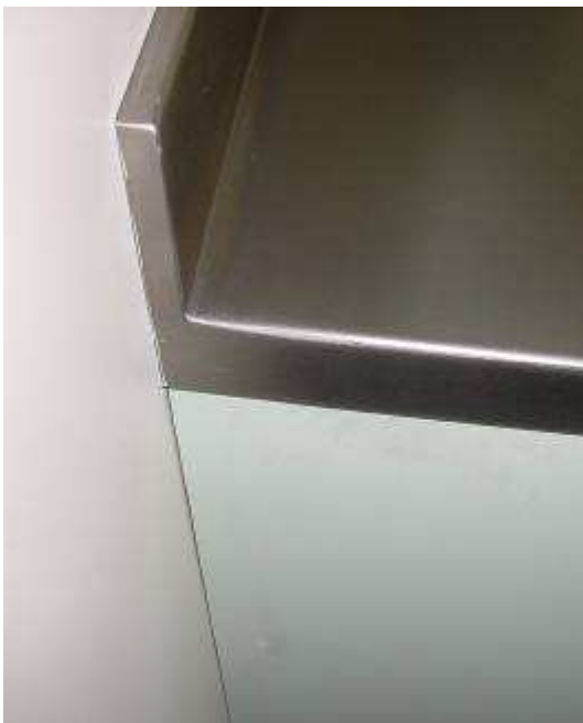
DETALLE DEL ACABADO TOTALMENTE SOLDADO DEL LATERAL Y PETO SUPERIOR DE LA ENCIMERA