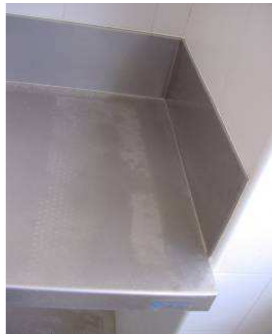
ENCIMERAS ENCASTRADAS EN EL ALICATADO