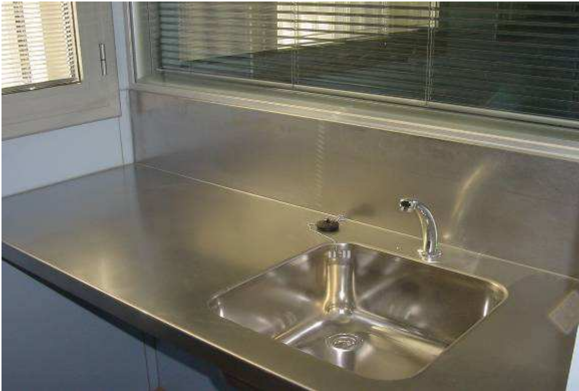
ADAPTACIÓN DEL PETO A LA ARQUITECTURA DE LA SALA