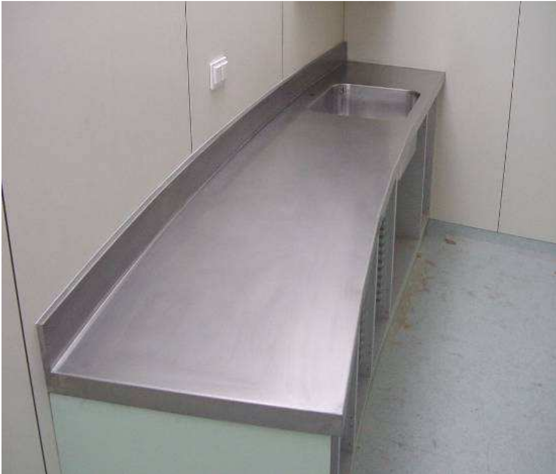
IMAGEN DE UNA ENCIMERA EN CURVA, ADAPTADA A LA INCLINACIÓN DE LA PARED.