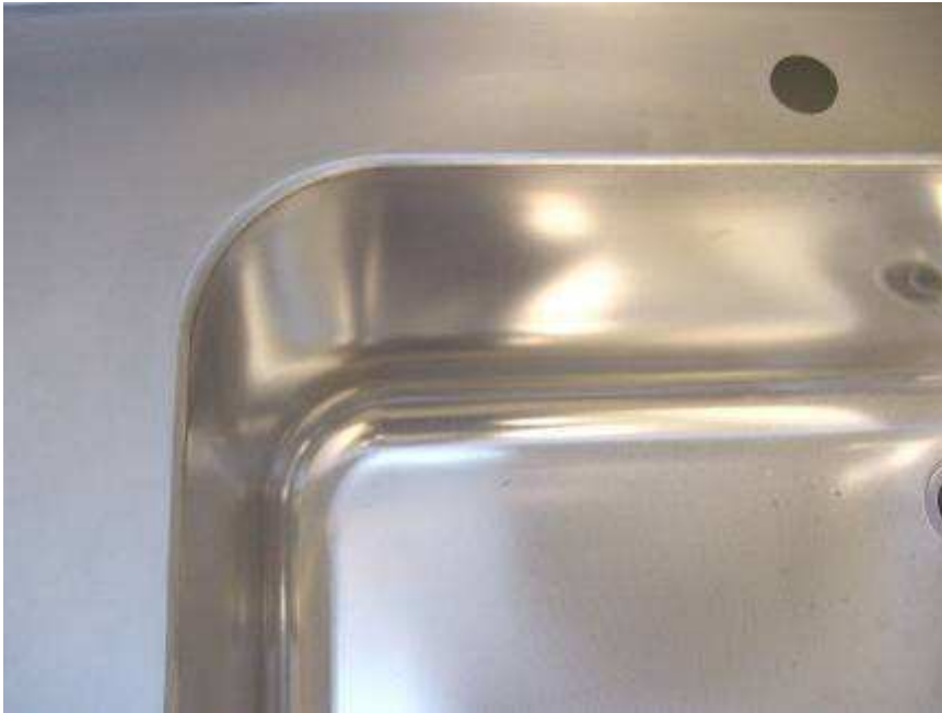
DETALLE DE LA CUBETA UNA VEZ SOLDADA Y PULIDA