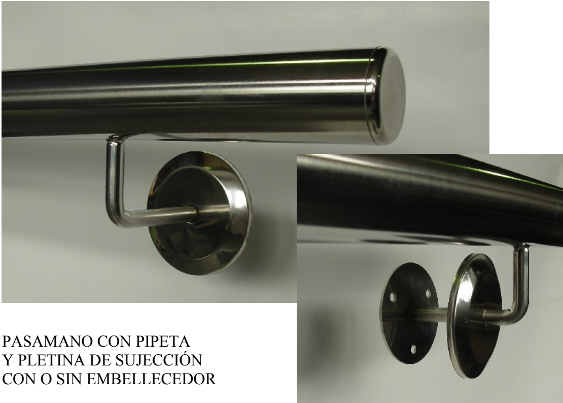
PASAMANO CON PIPETA Y PLETINA DE SUJECCIÓN CON O SIN EMBELLECEDOR

LOS FINALES DE TUBOS PODRAN SER, POR TAPON MACIZO EN ACERO INOX O PIEZA SOLDADA.